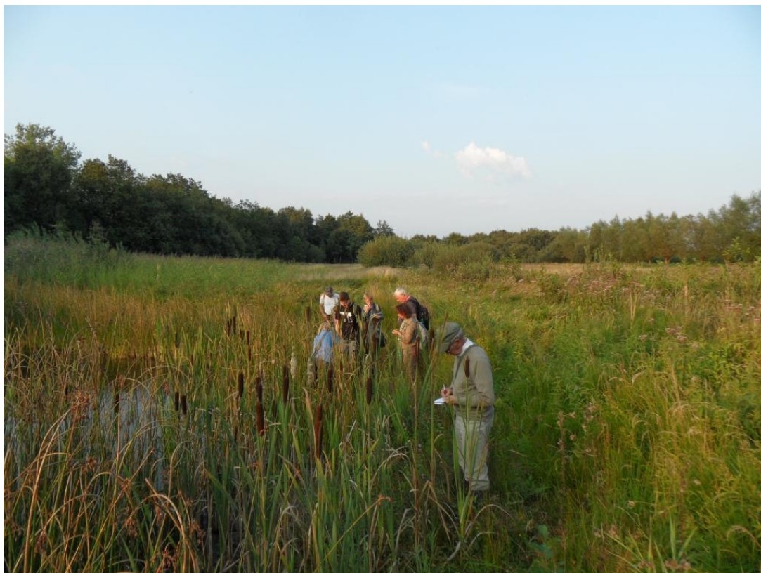
Hoe ernstig toch die slobkousjes