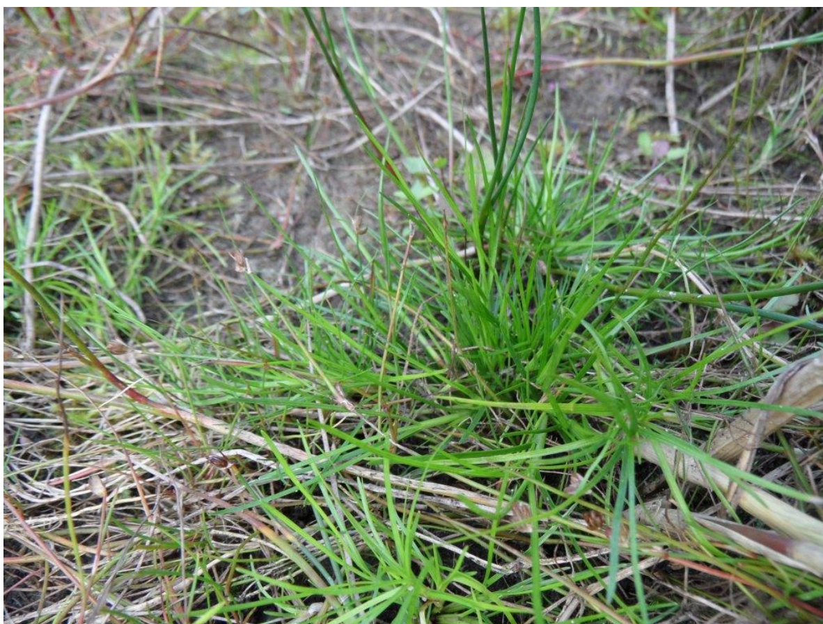
ze hadden vast die vlottende waterbies in de gaten