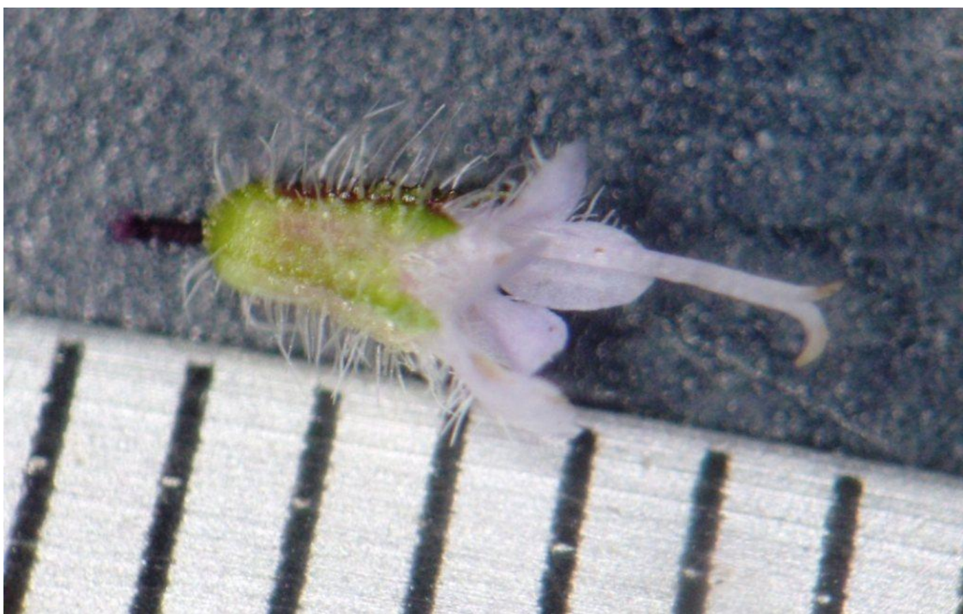
kransmunt onder de bino